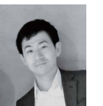
SE部 西日本地区担当 プロフェッショナルSE