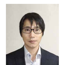
SE部 北関東地区担当 プロフェッショナルSE

商品を欲しいタイミングで発注ができることが当たり前となった今、企業内で使用するカタログやノベルティもタイムリーに発注できておりますでしょうか。企業ブランディングはタイミングが重要ですので、クラウドサービスの「Edition PriBiz」により企業内ECサイトを短時間で立ち上げ、在庫管理や受発注業務の効率化に貢献いたします。また、お客様一人ひとりに合わせながらもガバナンスの効いたカタログやリーフレットの作成について事例を交えてご紹介いたします。