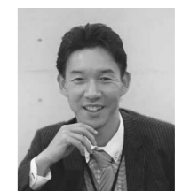
SE部 西日本地区担当 マネージャー

来年度の出生数は80万人を割るとも言われており、さらなる少子化が懸念されています。この超少子化時代に向けて、一人一人とのより緊密な顧客接点が重要になると考えており、本セミナーでは、「模試成績表」を活用した顧客接点強化とともに、これまで富士ゼロックスが取組んできたお客様の模試業務の課題に対する改善案などを事例を交えてご紹介します。顧客接点強化を目指す模試業務に携わる皆様に向けての内容です。