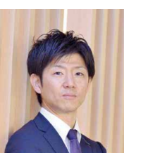
SE部 金融業担当 リーダー